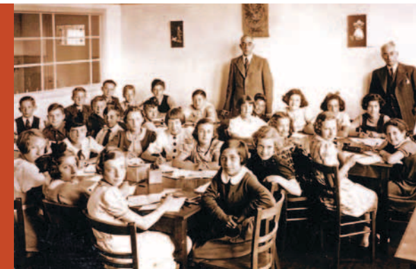
Zesde klas Beekmanschool, 1939

In ieder huis is een spreker aanwezig die het verhaal vertelt. In sommige gevallen is het een familielid van de voormalige bewoners. In de meeste gevallen is het iemand die zich betrokken voelt bij de geschiedenis van de slachtoffers en zich verdiept heeft in hun leven. De sprekers vertellen de verhalen, waar mogelijk doen ze dit met gebruikmaking van foto's en ander ondersteunend materiaal. Ieder verhaal duurt maximaal een half uur. Daarna is er gelegenheid om vragen te stellen of na te praten. Na uiterlijk drie kwartier wordt de bijeenkomst beëindigd.