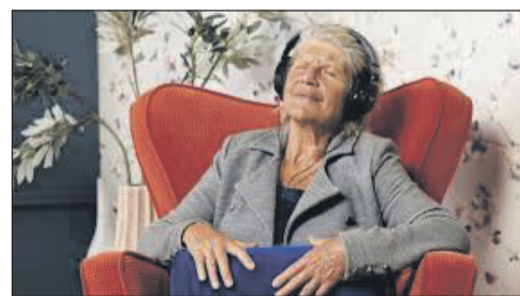
KozieMe van Tactile Orchestra

KozieMe is een zacht kussen met ingebouwde speaker. Neem plaats in de stoel en raak het kussen aan. Het kussen laat geluiden horen, waardoor u kunt luisteren naar uw favoriete geluiden.